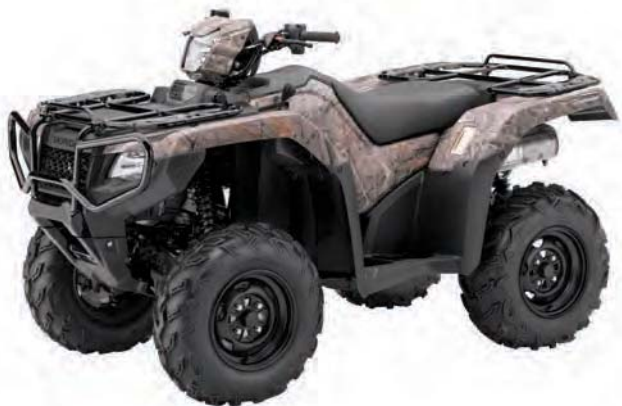
Камуфляж (показана модель с EPS)