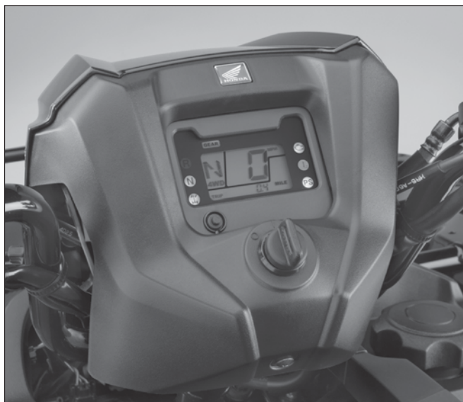
В многофункциональную жидкокристаллическую панель приборов включена система напоминания о периодическом техническом обслуживании. С ней владельцам будет проще следить за техническим состоянием своих мотовездеходов