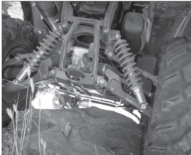
Новая дуплексная рама и независимая задняя подвеска на двойных поперечных А-образных рычагах увеличивают дорожный просвет, что позволяет справиться с тяжелым бездорожьем